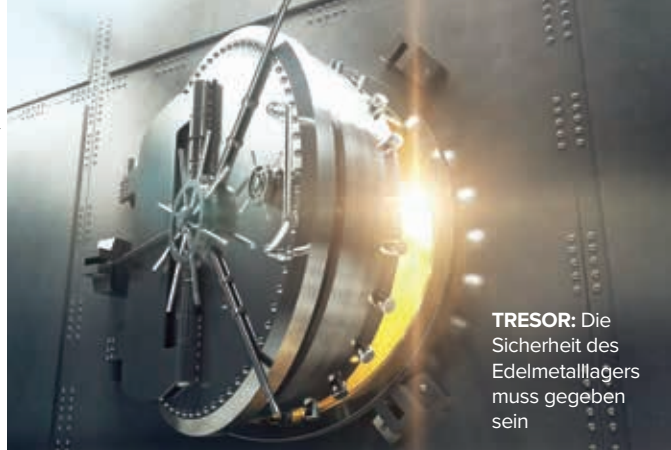
TRESOR: Die Sicherheit des Edelmetalllagers muss gegeben sein